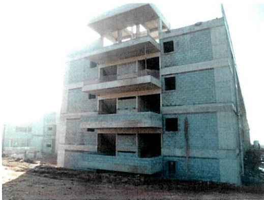
ZETA - FACHADA LESTE