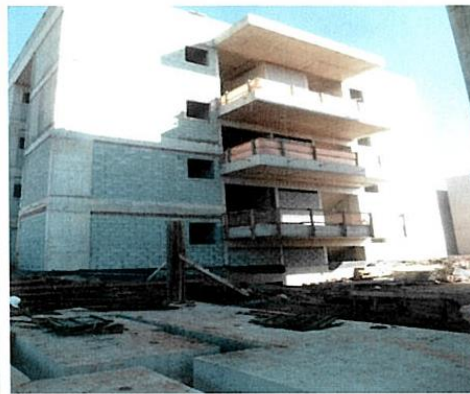
ZETA - FACHADA OESTE