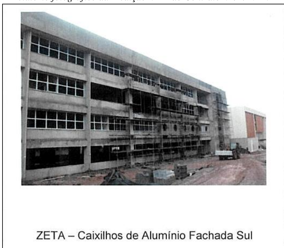
Figura 1 - Relatório fotográfico da Medição nº 22 do Contrato nº 94/2011.

- Por sua vez, a execução dos itens de caixilhos no Bloco Zeta começa a constar em relatório fotográfico apenas a partir da Medição nº 21, mas já constava informada desde a Medição nº 17, referente a junho de 2013, denotando adiantamento indevido de, pelo menos, quatro meses, nos montantes indicados no quadro a seguir: