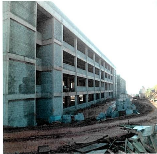
ZETA- FACHADA SUL