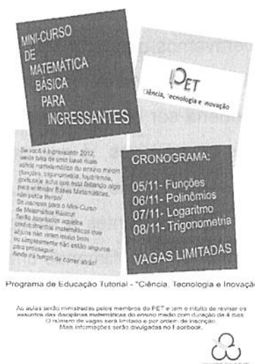
Figura 1. Panfletos utilizados na divulgação do curso de matemática.

Foi promovido também um curso de lógica básica, com nove horas de duração, divididas em 3 tardes, realizado no início de 2013. O curso tratou de uma introdução a conceitos básicos de lógica e treino no desenvolvimento de algoritmos, com a finalidade de introduzir o aluno aos possíveis problemas encontrados ao elaborar programas, incluindo: