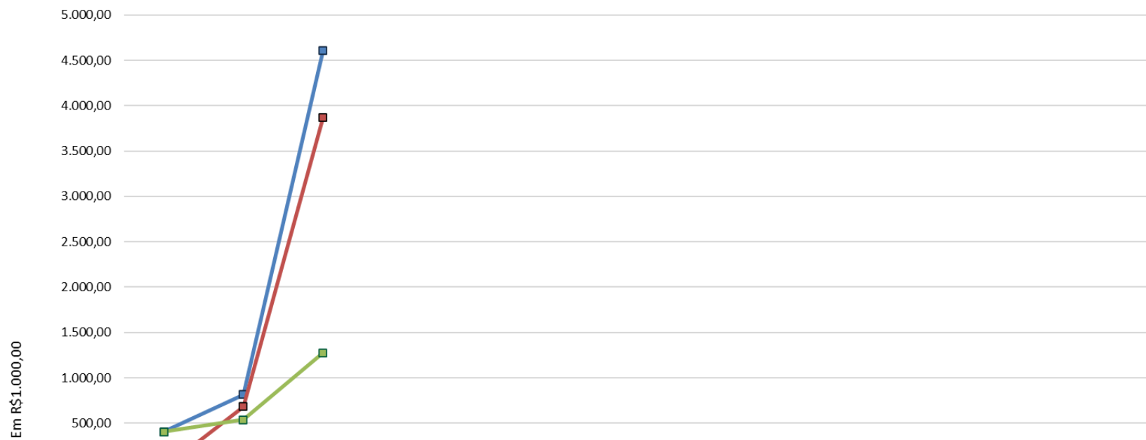
Liberação de Recursos Financeiros em 2020